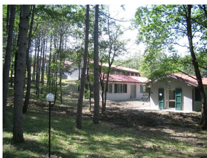
Ostello per i piccoli

Sistemazione: Ostello Comunale Suviana , dotato di ostello e campeggio, campi sportivi, ristorante, spiaggia, ampi spazi comuni, discoteca, bar e market. La sistemazione sarà in ostello per i piccoli e in tent-house per i grandi, con spazi e servizi riservati al gruppo. La struttura offre campi sportivi, spazi per l'animazione, spiaggia vigilata. I pasti si consumeranno presso il ristorante.