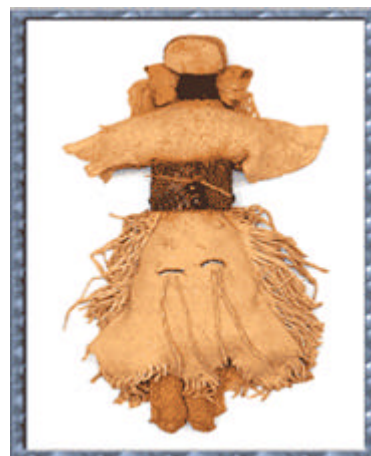
Nelle tre immagini, in ordine: Cavallino Araphao; Bambola Hopi; Bambola Dakota

toli. A questi giocattoli davano poi un "senso", cioè un significato, per esempio: la bambola centrale (bambola Hopi) ha i capelli acconciati secondo lo stile delle ragazze "hopi" non sposate. Quando una ragazza apache entrava nella pubertà, si celebrava una cerimonia che durava quattro giorni, con canti rituali alternati a festeggiamenti. La ragazza Apache come quella Hopi, imparava da una donna più anziana le sue responsabilità future e partecipava ad una corsa rituale per provare la sua forza ed il suo coraggio. Solo allora era pronta per il matrimonio. Il giocattolo così acquistava grande importanza perché rappresentava un momento particolare della vita. Forse è così anche per voi e se volete potete raccontarlo scrivendo alla Redazione del Giornalino della Ludoteca. (v.b.)