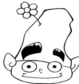
Il logo de "Il Piccolo Popolo" creato da Serena Giordano

Questo semplice ma tenace giornalino vuole essere la testimonianza di tutto ciò che Il Piccolo Popolo ha costruito, sta costruendo e costruirà ancora nei prossimi anni. (a.a.)