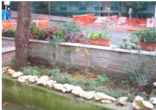
Una delle aiuole realizzate dai bambini

lezione di responsabilità e impegno civile a tutti noi, piantando rosmarino, salvia, fragole, menta, edera e tanto altro ancora. (a.a.)