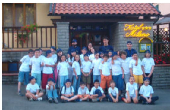
I bambini e gli animatori del primo turno, in "divisa", davanti alla base del soggiorno, l'Albergo Milano

Nel complesso i bambini si sono presto adattati ai ritmi e alla nuova "casa" (il nostro caro Hotel Milano, un grazioso tre stelle al centro del paese) e hanno vissuto quest'avventura con uno spirito e un coraggio degni di Robinson Crusoe, socializzando e scoprendo valori importanti quali l'aiuto, il rispetto, la solidarietà... e le