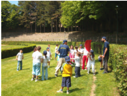
Giochi al campo sportivo offerto dal Comune di Abbadia