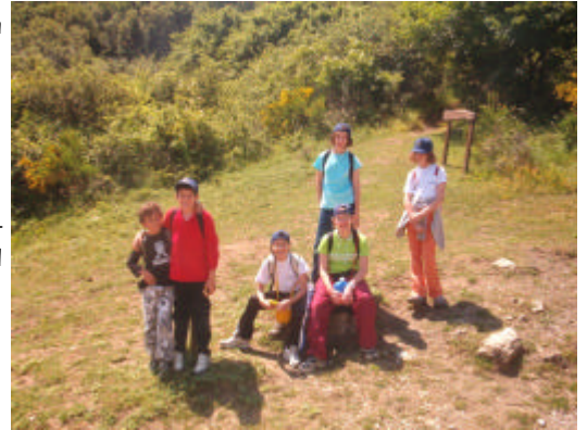
Sosta al Campo Robinson... prima dell'arrivo dei cinghiali